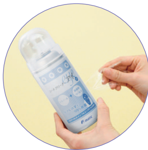
密封スプレータイプなので異物混入なく衛生的