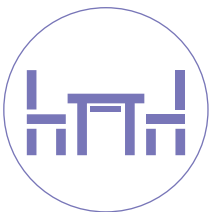
イス・テーブル など

※人体に向けて使用しないでください。※すべての材質に使用できるわけではありません。(水分やアルコールに弱い材質などは不可) ※便座以外でご使用の際は、必ず目立ちにくい箇所を試してからご使用ください。