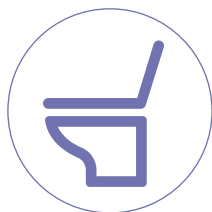
洋式トイレ (便座・フタなど)