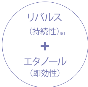
除菌剤はダブル効果を発揮