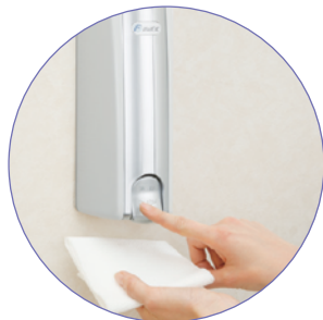
ワンプッシュで手軽に除菌