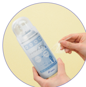
密封スプレータイプなので異物混入なく衛生的